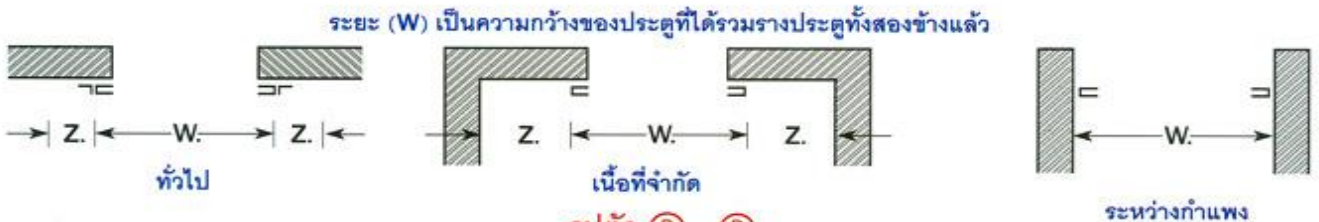
รูปตัด (B) - (B)